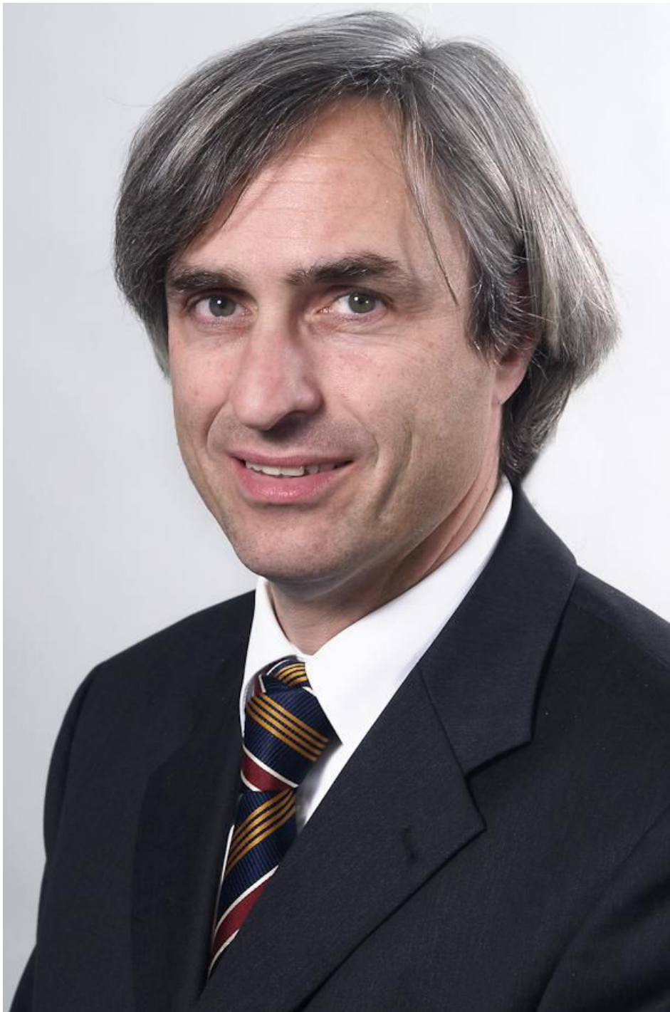
Leiter des Kompetenzzentrums Elektronischer Personalausweis.